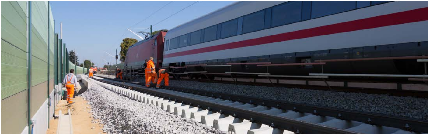
Die Planung und der Bau von Schallschutzmaßnahmen...