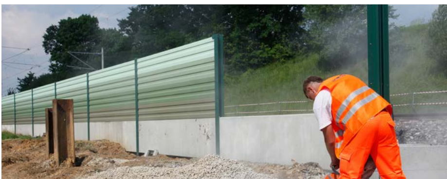
... gehören zu den wichtigen Themenblöcken des Einwendungsmanagements.